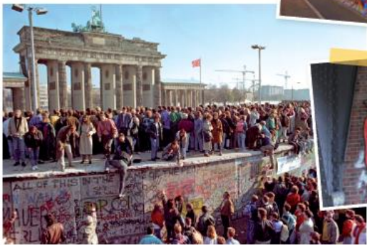
Berlino, 9 novembre 1989.

Il brano Markus ed Ewa , contenuto nel disco Storie d'amore con pioggia e altri racconti di rovesci e temporali (2022), è ambientato a Berlino dove i due innamorati vivono serenamente fino al 13 agosto 1961, giorno in cui viene eretto il muro a dividere la città in due parti: Berlino Ovest e Berlino Est. Non c'è possibilità di oltrepassare il confine tracciato dal muro e Markus è obbligato a risiedere a Ovest, mentre Ewa a Est. Il muro sembra spezzare l'amore dei due giovani, ma Markus non accetta questa prospettiva e «tutti i giorni sale su un lampione da lì spera di vederla là tra il muro e il sole» perché «da quel giorno lo ha detto, ha promesso e la aspetta, da quel giorno l'ha persa». Finalmente la speranza di ritrovarsi, ormai quasi perduta, si realizza: il 9 novembre del 1989 il muro di Berlino viene finalmente abbattuto. Markus inizia subito a cercare Ewa dopo 30 anni. Inizialmente la donna sembra scomparsa, irrintracciabile e finché Markus non se la ritrova davanti, quasi «come in un sogno. Finalmente i due possono riabbracciarsi e in quell'abbraccio vibra il viaggio di una vita intera».