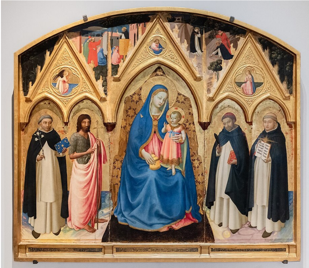
Firenze, Museo nazionale di San Marco (1422-1423?)