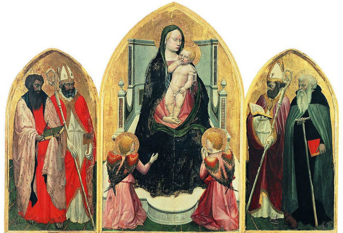
Cascia di Reggello, Museo di Masaccio, 1422