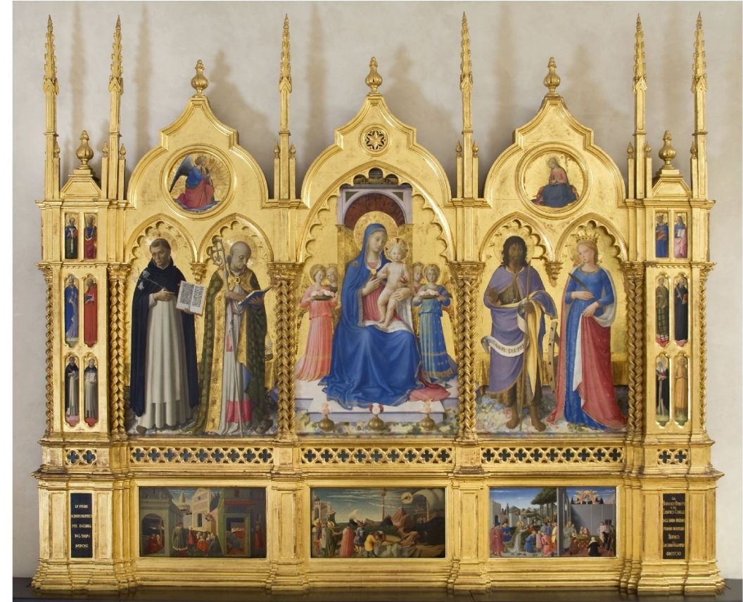
Perugia Galleria Nazionale dell'Umbria, 1437-1443.