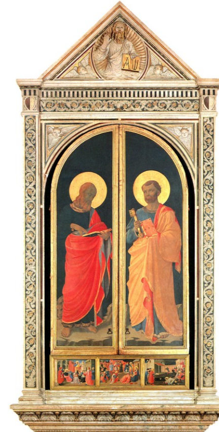
Beato Angelico e Lorenzo Ghiberti, Firenze, Museo di San Marco, 1432-1436