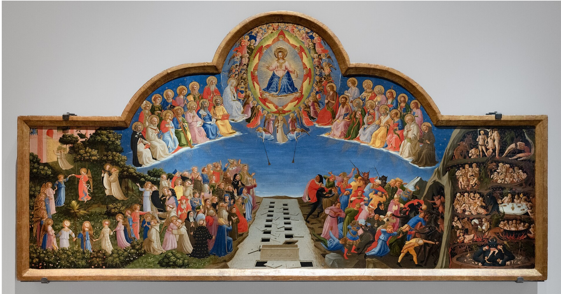
Firenze, Museo nazionale di San Marco (1425-1428)