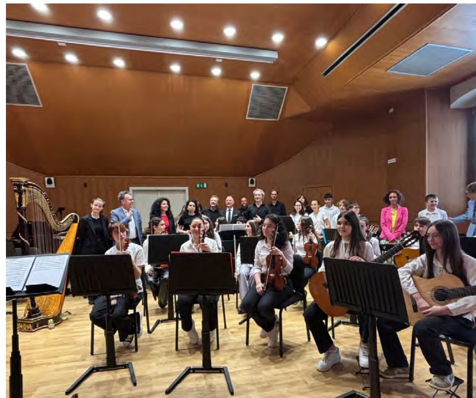
Foto di un concerto tenuto il 17 maggio 2025.