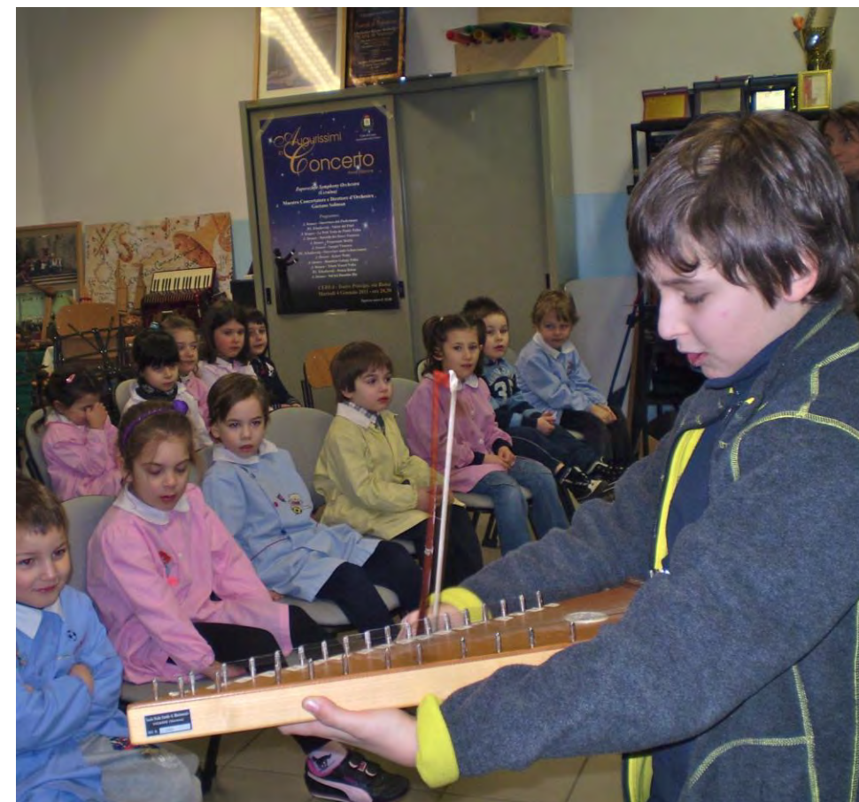
Scoprire, ascoltare e presentare gli strumenti.