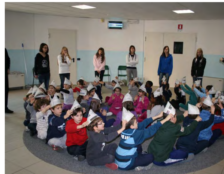
Incontro tra alunni di età diverse.