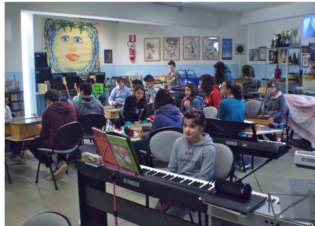
La classe nel Laboratorio di Musica