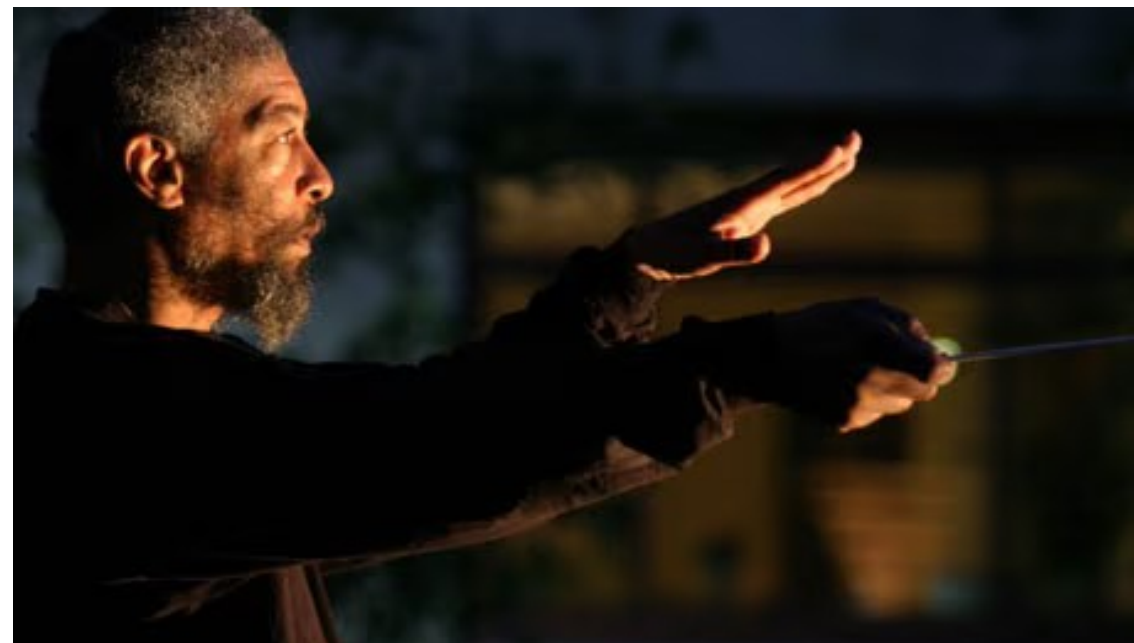
Laurence “Butch” Morris

La lezione di “Butch” Morris può essere raccolta e accolta non soltanto da leader di gruppi jazz ma anche da direttori ed ensemble di musica classica e contemporanea (offrendo un interessante complemento all’interpretazione tradizionale basata sulla resa sonora della partitura) e della didattica musicale, dall’insegnamento ai bambini ai ragazzi, ai corsi avanzati di Conservatorio.