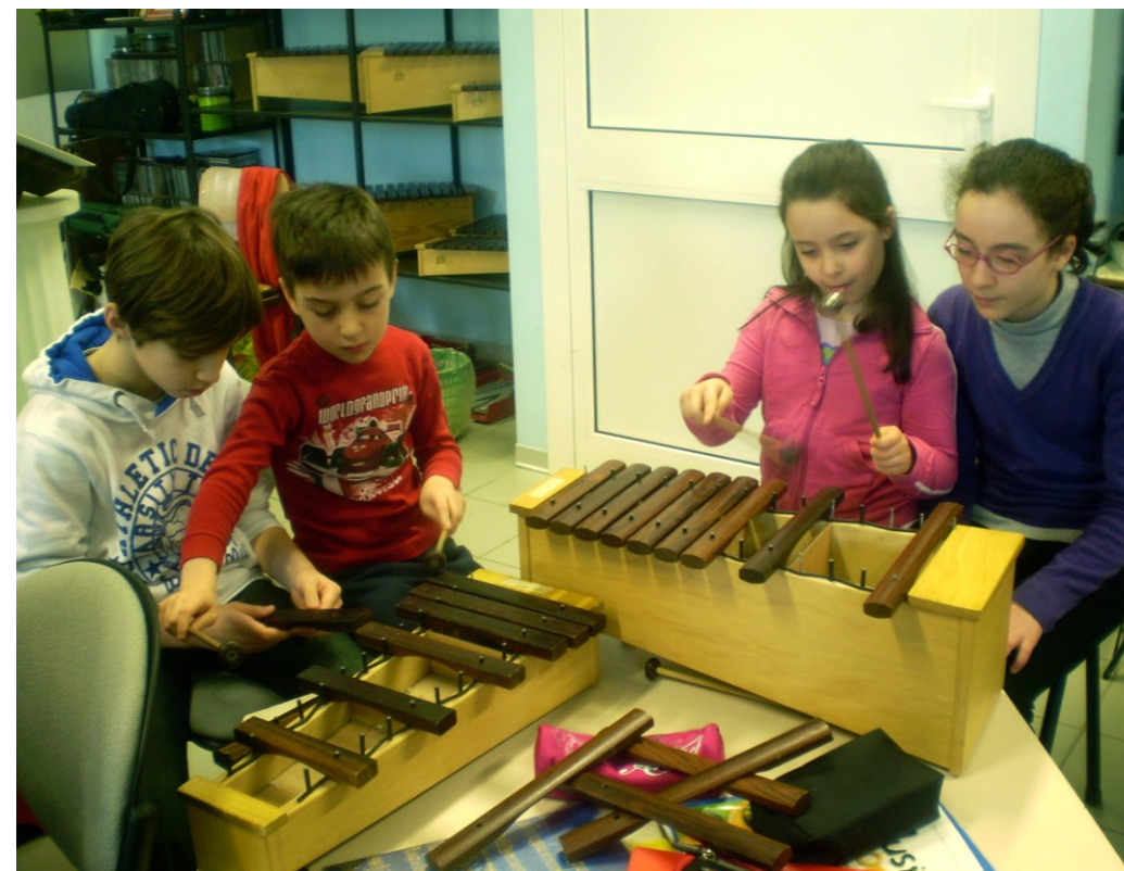
Un progetto in rete, incontrarsi nel Laboratorio.