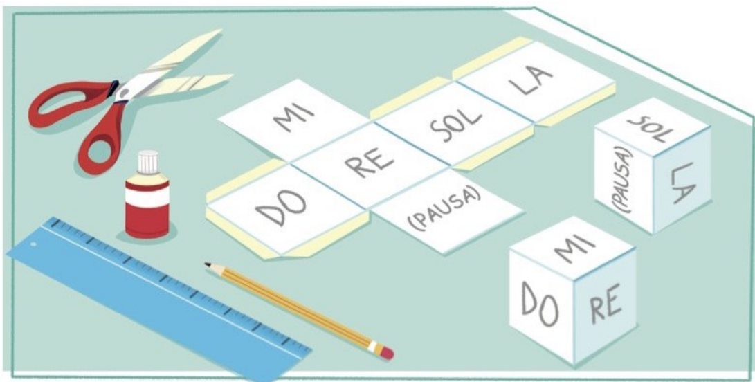
Il dado per creare una musica aleatoria .

La scala formata da cinque suoni, la pentatonica , comprende il primo, il secondo, il terzo, il quinto e il sesto grado della scala maggiore. Queste cinque note suonate in successione creano già una sorta di melodia, evitando semitoni e dissonanze.